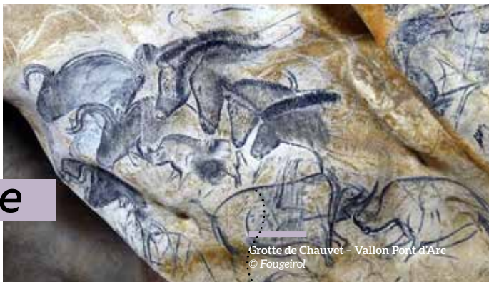
Grotte de Chauvet - Vallon Pont d'Arc

Une journée complète entre sport et découverte gustative encadrée par des passionnés de l'Ardèche : sa rivière, ses vins et ses produits du terroir.