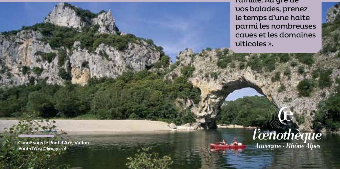
Canoë sous le Pont d'Arc, Vallon- Pont-d'Arc

« Berceau incomparable pour l'épanouissement de la vigne, l'Ardèche vous assure de belles sorties en famille. Au gré de vos balades, prenez le temps d'une halte parmi les nombreuses caves et les domaines viticoles ».